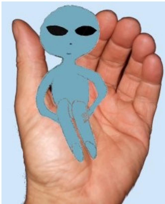
Winzling eines Hybridwesen (nachempfunden)

Befruchtung und Entnahme des Fötus kann sowohl ambulant (im Schlafzimmer), als auch stationär (im Raumschiff) erfolgen.